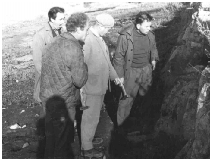
Євген Лазько з колегами вивчає відслонення на Українському щиті.

Геологічні дослідження без вивчення металогенічної спеціалізації різновікових структурно-формаційних комплексів щитів не є повними і завершеними. Саме з позиції праці “Формационные комплексы архея и их металлогения” (Є. Лазько. Изв. АН СССР. Сер. геол., № 7, 1987) розглядають металогенію архею, що детально і глибоко проаналізована в винятковій і свого роду поки що єдиній монографії “Металлогения архея” (2005), яку вчений підготував разом з учнями. На жаль, у друкованому вигляді він уже не зміг її побачити, як і не побачив дуже змістовний навчальний посібник “Ендогенні рудні формації” (2004), де вчений розкрив новітні уявлення про рудноформаційний аналіз, зміст поняття “рудна формація”, головні, другорядні й екзотичні рудні формації, їхні групи і ряди, просторові закономірності поширення та їхню еволюцію в геологічній історії розвитку земної кори. Ці праці – часова вершина його наукової творчості. Є. Лазько їх написав у дуже зрілому віці. По суті, наш Великий учений і Справжній учитель працював до останнього подиху життя, що під силу неординарним особистостям, які зберігають необхідну силу духу й інтелектуальну та фізичну здатність до улюбленої праці навіть у завершальну мить буття.