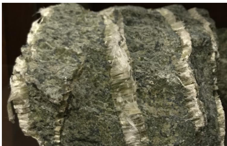
Рис. 3. Косоволокнисті агрегати хризотил-азбесту в серпентиніті Баженівського родовища

– складні облямовані жили хризотил-азбесту в серпентиніті серед перидотитів (Баженівське родовище, Урал);