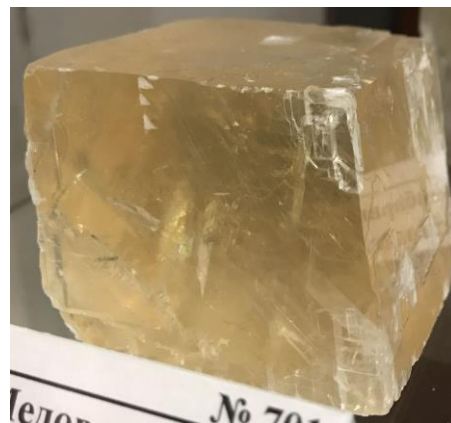
Рис. 5. Ромбоєдр медового ісландського шпату

Завершуючи цей короткий опис колекції нерудної сировини Музею рудних формацій, варто зазначити, що експозиція є унікальною і викликає зацікавлення не лише у фахівців. З великим інтересом оглядають колекцію школярі різного віку, студенти різних спеціальностей та звичайні громадяни, яким не байдужий світ мінералів та гірських порід. Величезна кількість зразків міститься у фондах і потребують детального вивчення з метою подальшого експонування на вітринах музею та обміну з іншими природничими музеями.