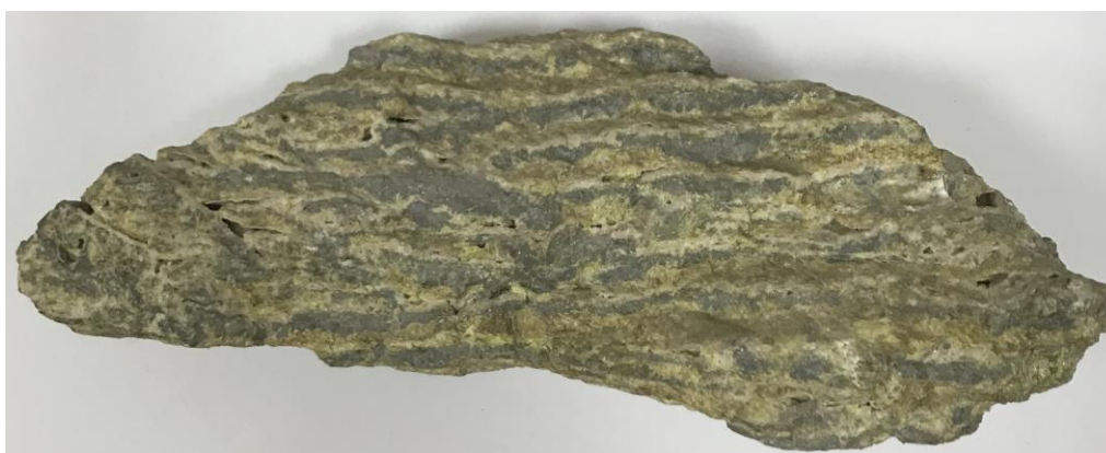
Рис 1. Виділення самородної сірки і кальциту смугастої текстури у вапняках Роздільського родовища (Львівська область)