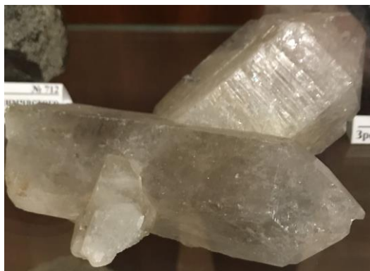
Рис. 4. Здвоєний кристал гірського кришталю