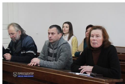
Учасники XII наукових читань імені акад. Євгена Лазаренка.

У третьому розділі схарактеризовано презентації книги “Академік Євген Лазаренко. Нарис про життєвий і творчий шлях, спогади, фотоальбом” (автори нарису й упорядники О. Матковський, П. Білоніжка, В. Павлишин; Львів, 2005), які відбулися у Львові й Києві, та круглі столи пам’яті Є. Лазаренка, пов’язані з відзначенням у грудні 2011 р. 350-річчя Львівського університету. Четвертий розділ присвячено столітньому ювілею Євгена Костянтиновича. Опубліковано книгу “Євген Лазаренко – видатна постать ХХ століття” (автори доповідей і упорядники О. Матковський, П. Білоніжка, В. Павлишин; Львів, 2012), яка містить тексти доповідей, оголошених на круглому столі 2011 р., 30 спогадів про Є. Лазаренка геологів, філологів, фізиків, поетів, співаків. У Геологічному музеї Національного науково-природничого музею НАН України проведено наукову конференцію “Такий різний світ мінералогії” (квітень, 2012), під час якої відкрито вітрину “Академік Лазаренко Євген Костянтинович”; на базі спортивно-оздоровчого табору “Карпати” ЛНУ імені Івана Франка відбулися Сьомі наукові читання імені академіка Євгена Лазаренка на тему “Розвиток ідей академіка Євгена Лазаренка в сучасній мінералогії” (вересень, 2012); урочисті академії, присвячені столітньому ювілею вченого, проведено в ЛНУ імені Івана Франка (24.12.2012) та ІГМР імені М. П. Семененка НАН України (26.12.2012).