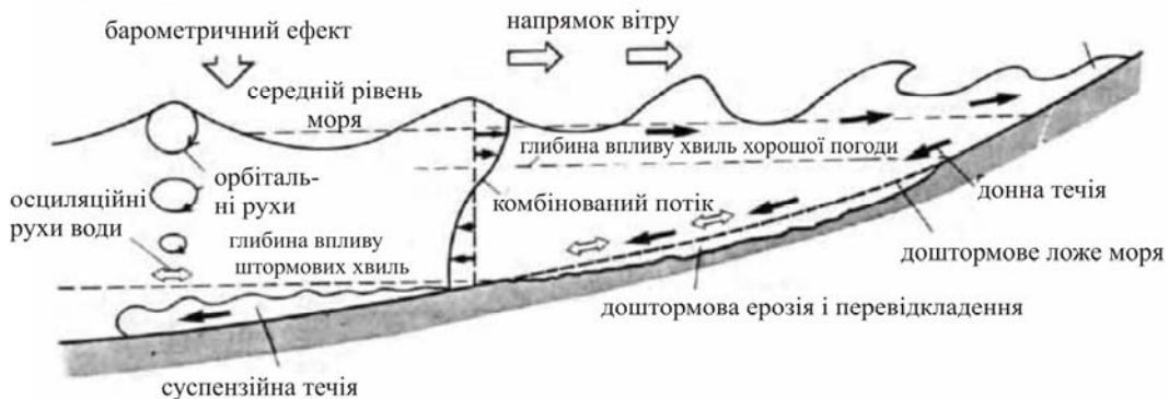
Рис. 2. Динамічні умови водної маси моря на час утворення темпеститів [21]

На думку багатьох дослідників, горбиста скісна шаруватість зумовлена штормовим перевідкладенням піску нижче нормальної хвильової межі [10, 17, 21, 25]. Уламковий матеріал, збурений на мілководді штормовими хвилями, надходить зі зворотними донними течіями у віддалену зону підводного схилу берега та осаджується спершу із водного потоку, а тоді випадає із зависі (рис. 2). Ерозійна й акумулятивна дія зворотних донних течій, імовірно, поєднані через імпульсивну і нерівномірну по площі динаміку таких водних потоків та власне мінливу енергію шторму. Відсутність орієнтування за горбистого нашарування підтверджено структурними діаграмами, виконаними дослідниками [21]. Це робить горбисте скісне нашарування таким, що різко відрізняється від упорядкованих текстур брижів.