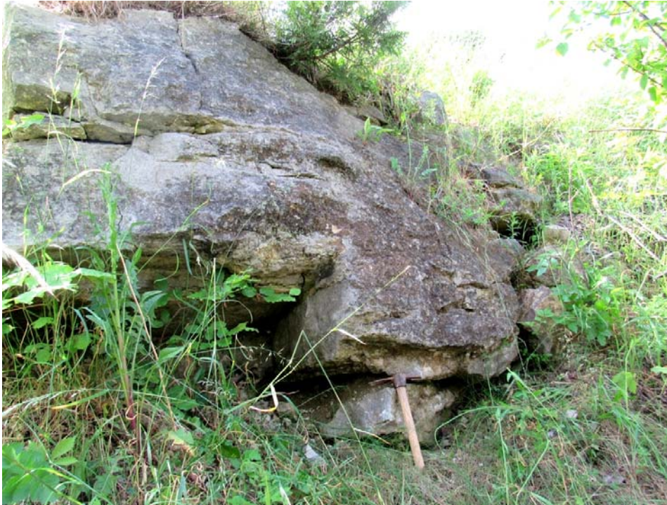
Рис. 3. Відслонення штормових відкладів на схилі г. Кортумової

бинах ніш. Фрагменти серпул орієнтовані паралельно нашаруванню. Порода загалом складена несорттованим різнозернистим і неокатаним матеріалом.