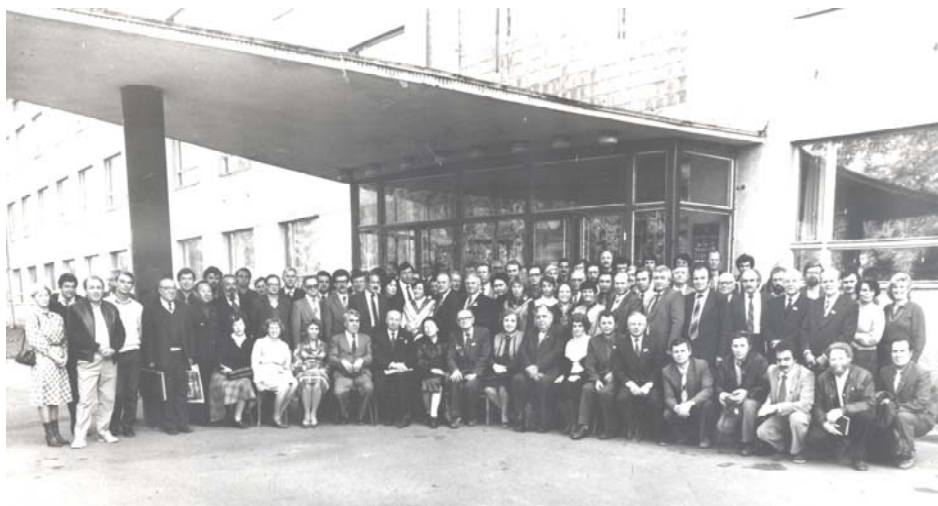
Рис. 6. Учасники VII Всесоюзної наради “Термобарометрія и геохімія рудоутворювальних флюїдів (за включеннями в мінералах)” (Львів, Інститут геології і геохімії горючих копалин АН УРСР, 1985 рік). У першому ряді видатні вчені – учасники цього історичного форуму (зліва направо): професор Лев Хетчиков (4-й), професор Володимир Калюжний (5-й), професор Ніна Петровська (6-та), професор Микола Єрмаков (7-й), доцент Нінель Мязь (8-ма), професор Юрій Долгов (9-й)

Узимку під час активного відпочинку він ставав азартним учасником колективних вояжів за судаком на підводній рибалці в “Обському морі”, в компаніях знайомих і друзів був захопливим співрозмовником, блискучим оповідачем і душею колективів. Він завжди був підтягнутим та усміхненим. Читав доповіді або лекції спокійно, розважливо, налаштовуючи слухачів до себе. За незнання чого-небудь, навіть іноді найпростіших речей, й на іспитах зокрема, він ніколи не дивився на студента як на безнадійність. Був дуже делікатним в усьому. Спокійна поведінка Ю. Долгова часто ставала причиною дружніх жартів його товаришів. Зокрема, Д. Хітаров на нарадах казав: “Юрій Олександрович, не спіть”. А той у відповідь – “Дмитре Миколайовичу, я все чую”. Він не тільки все чув, а й усе пам’ятав. Як-от це було 1985 р., на V Всесоюзній нараді з термобарогеохімії у Львові. На екскурсії в Закарпаття коментарі М. Братуса як виконувача обов’язків екскурсовода нагадали йому про його поїздки туди під час праці у Львівському університеті. Під тим впливом Ю. Долгов, звертаючись до усіх, раптом сказав про М. Братуса: “А я пам’ятаю, він був таким маленьким, коли вступив на навчання”. А з часу вступу М. Братуса на геологічний факультет пройшло 30 років! Такій пам’яті можна позаздрити.